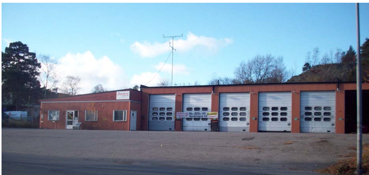
Påbyggnaden från 1970 med garage och kontor.