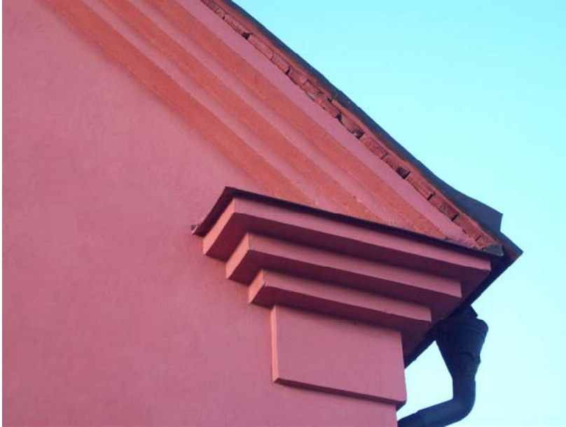
Detalj av takfoten. Här ser man också att plåttaket är lagt på brädor.