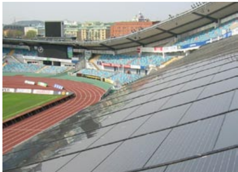
Ullevi.