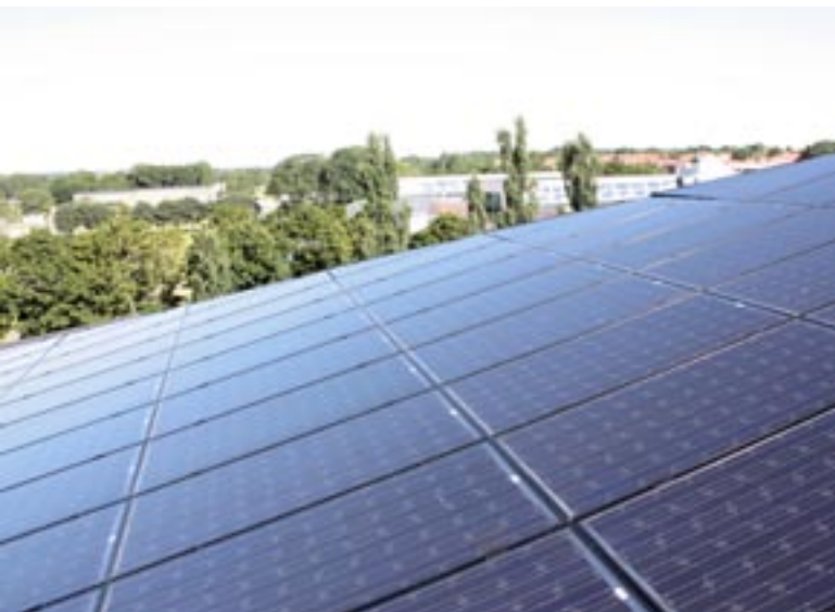
Fyrishov.