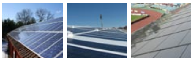
Polykristallina solceller.

Solceller tillverkas i flera varianter, oftast med kisel som råvara. De vanligaste solcellerna tillverkas av kiselskivor och är 10x10 till 15x15 cm. Dessa skivor kan bestå av en eller flerkristallint kisel. Verkningsgraden för moduler av skivbaserade kiselceller är 12–15 %. Moduler kan också tillverkas i tunnfilmsutförande, d.v.s. man belägger en hel modul med en tunn film av det aktiva solcellsmaterialet, vilket ger lägre energiåtgång och lägre tillverkningskostnad. Det finns olika typer av tunnfilmstekniker, normalt har de något lägre verkningsgrad än kristallina kiselceller, verkningsgrad ligger vanligtvis mellan 7–11 %.