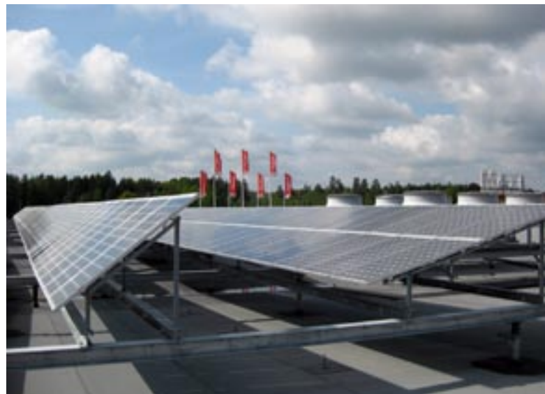
ICA Maxi, Erikslund, Västerås.