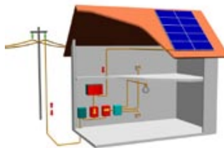
Illustration: NAPS Systems AB

Elen från solcellerna matas ut på elnätet via en växelriktare. Ett eventuellt elöverskott på dagen matas ut till nätet för försäljning. På natten tas elbehovet från nätet. Växelriktaren omvandlar likström till växelström, håller cellerna vid den spänningsnivå där de ger störst effekt, och fasar automatiskt in elen på nätet. Dessutom bevakar växelriktaren spänningsnivån på nätet för att säkerställa att ingen farlig spänning hamnar på utgången om det blir elavbrott på nätet.