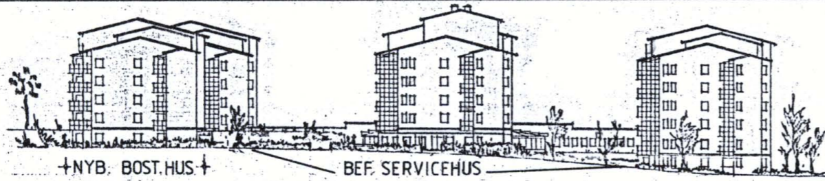
GÄVELFASADER MOT ÅKARGRÄND, PRINCIP.