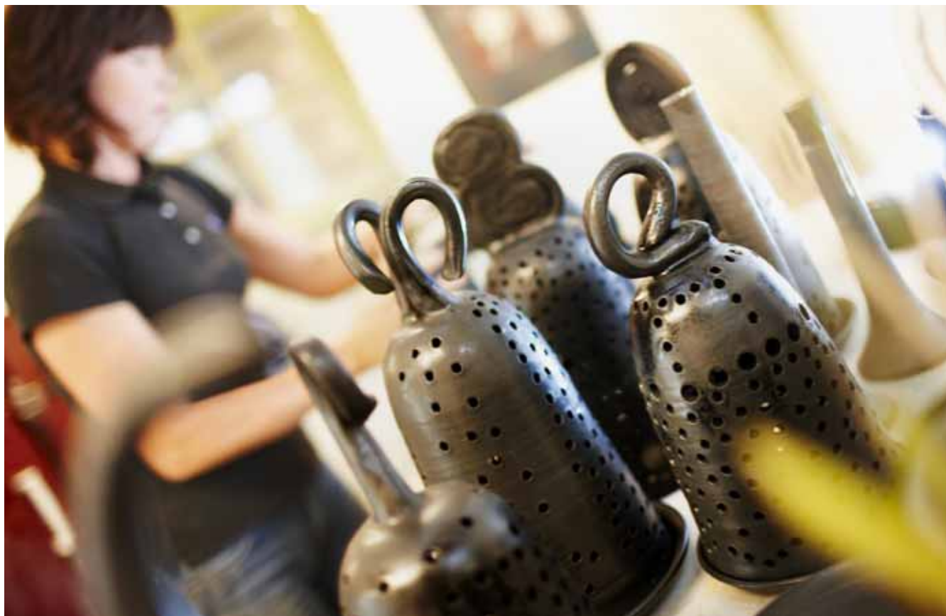
Condesign Communications 2009-09.

Landsbygdsnätverket når du genom tfn 036-15 50 00 eller via www.landsbygdsnatverket.se .