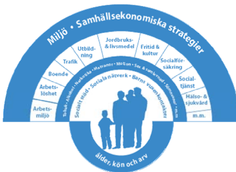
Figur 1: Hälsans bestämningsfaktorer

Hälsans bestämningsfaktorer (figur 1) ligger till grund för de målområden för folkhälsa som riksdagen enat sig om i propositionen om en förnyad folkhälsopolitik.