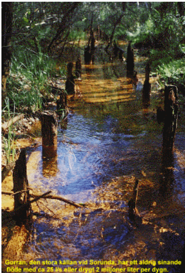
Gorran, den stora källan vid Sorunda, har ett aldrig sinande flöde med ca 25 l/s eller drygt 2 miljoner liter per dygn.

Brunns- och källinventeringar har utförts i anslutning till de två större åsarna, Uppsalaåsen och Tullingestråket, samt längs stråket med isälvsavlagringar mellan Muskan och Nynäshamn. De geofysiska mätningarna, sonderingsborrningarna och observationsrördrivningarna har i regel genomförts på ställen som varit viktiga för att utreda grundvattnets strömningsmönster och lägen för grundvattendelare. Grundvattenprover har tagits, och analyserats kemiskt, i sådana delar av sand- och grusavlagringarna som i dag inte utnyttjas, men som med avseende på deras potential skulle kunna utnyttjas i framtiden. Grundvattennivåerna som anges på kartan över grundvattentillgångarna i Nynäshamns kommun och i beskrivningen är uppmätta vid ett gemensamt tillfälle, kring