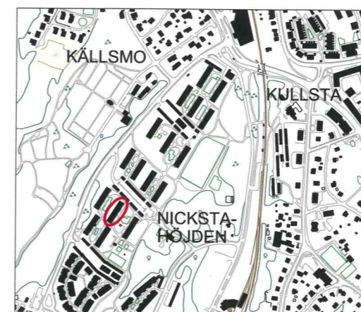
Översikt över planområdet

Genomförandetiden är 5 år från den dagen planen vinner laga kraft.