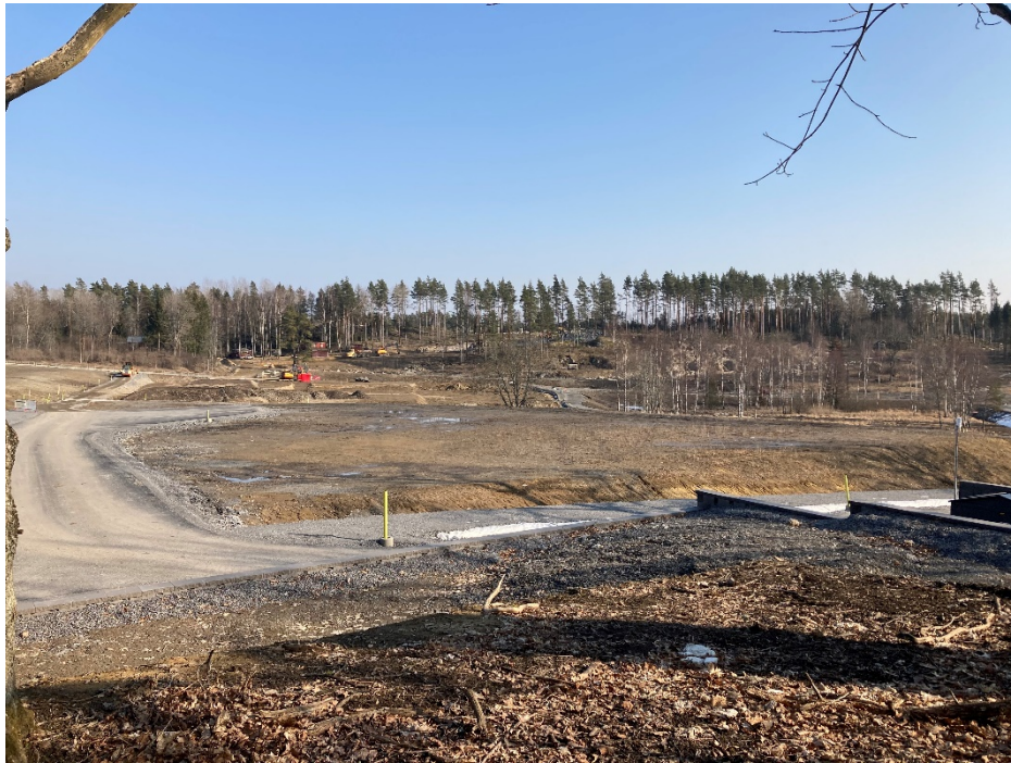
Foto från den 16/3-2022, taget från nordväst vid infarten till skoltomten. Området med björkar till höger i bakgrunden utgör ett mer sankt område på intilliggande naturmark.

Beskrivning Naturvärden saknas inom planområdet. Endast något enskilda träd är bevarat.