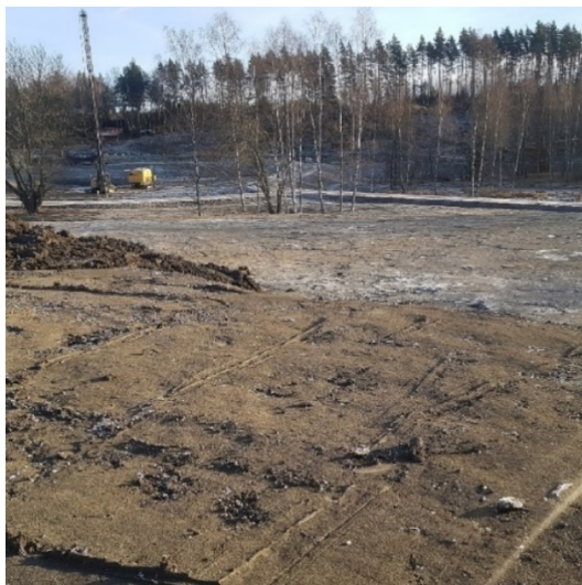
Foto på planområdet taget under våren 2022.

Platsen för planområdet är idag avschaktad och väntar på iordningställande för exploatering. Området runt själva skoltomten tillhör DP 864 och planområdet är en del av en större exploatering med ett helt nytt bebyggelseområde. Denna lilla planändring har därför ingen negativ inverkan ur kulturmiljösynpunkt på området.