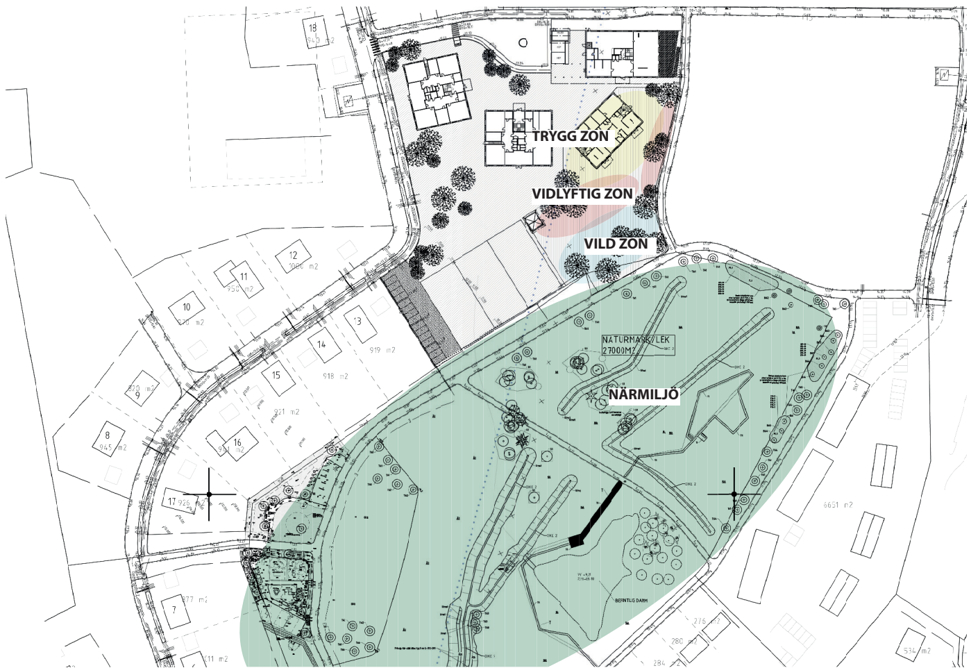
SITUATIONSPLAN ZONERING FÖRSKOLEGÅRD