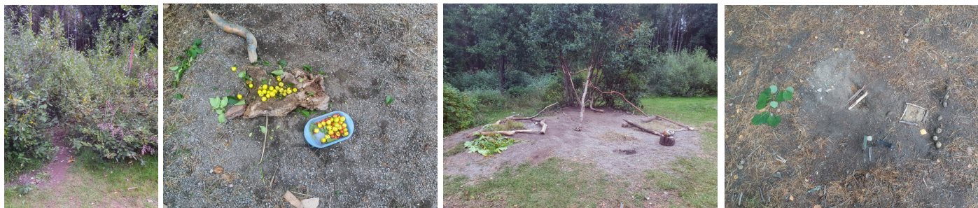
LEKEN I NATURMARK SKILJER SIG FRÅN LEKEN I DEN MER PROGRAMMERADE LEKMILJÖN. EXEMPEL FRÅN TAVESTASKOLAN, SÖDERTÄLJE.

Sammantaget ser vi att både förskolegård och skolgård har gynnsamma förutsättningar att utveckla gott lekvärdesinnehåll och naturpedagogik om ytorna samutnyttjas.