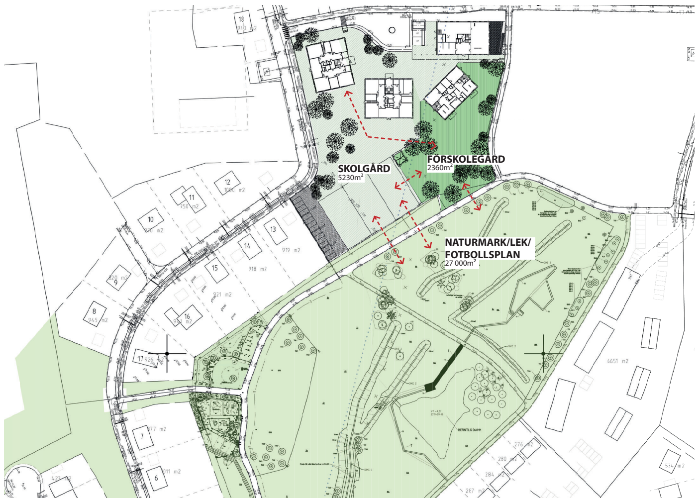
SITUATIONSPLAN YTOR OCH KOPPLINGAR

Kopplingen till naturmarken är viktig för skoleleverna. En tydlig kommunikation mellan skolgården och naturmarken föreslås, så att de bägge grönytor knyts ihop. De lägre årskurserna kan tillsammans med lärare eller fritidspedagoger göra utflykter till naturmarken, någon av lektyorna eller bollplanen, medan barnen på mellanstadiet brukar få röra sig friare och kan få tillgång till naturmarken på de längre rasterna, då den kan erbjuda en helt annan typ av upplevelse och lekinnehåll än vad skolgården ger. Även om vissa delar av naturmarken, exempelvis bollplanen, är placerad en bit bort från skolgården, så ligger den inom det avstånd som många skolor och fritids väljer att göra små "miniutflykter" inom. I Källberga finns inte någon barriär mellan skolgården och naturen, så eleverna kan röra sig i en trafikseparerad och trygg miljö.